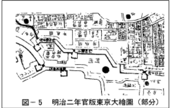
図-5 明治二年官版東京大繪圖（部分）

（西村公宏著「明治初期の開成学校等のランドスケープデザインについて」・日本造園学会誌「ランドスケープ研究」62巻5号1999年刊より）